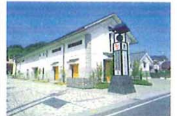
酒ミュージアム 松山 宮城県の銘酒「一ノ蔵」の蔵元の博物館。TEL0229-55-2700