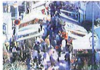
互市 (たがいち) 鹿島台 300の露店が並びます。4月と11月に開催。TEL0229-56-5520