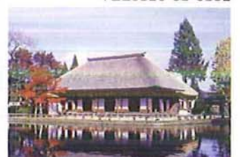
旧有備館及び庭園 岩出山 江戸時代の学問所の姿を今に伝える貴重な文化財。TEL0229-72-1344