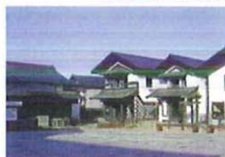
醸室 (かむろ) 古川 酒蔵や母屋がおいしいスポットに。古川の新名所。TEL0229-21-1020