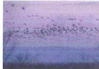
蕪栗沼 (かぶくりぬま) 田尻 国内有数の低地性湿地。マガンの飛来地。TEL0229-39-1115